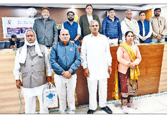
सोनीपत। झा के दौरान किसानों के साथ अधिकारीगण।

के अध्यक्ष विकास मलिक ने कहा कि मुख्यमंत्री ने 3 फरवरी 2025 को बहारगढ़ में आयोजित एक कार्यक्रम में सीपीएलओ की मांगों को पूरा करने का आश्वासन दिया था।