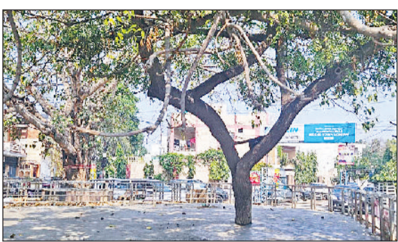
सोनीपत। मॉडल टाउन के टाकुर द्वार चौक पर पेड़ के चारों ओर कंक्रीट डालकर बनाया गया चबूतरा, लगाई गई ग़िल।