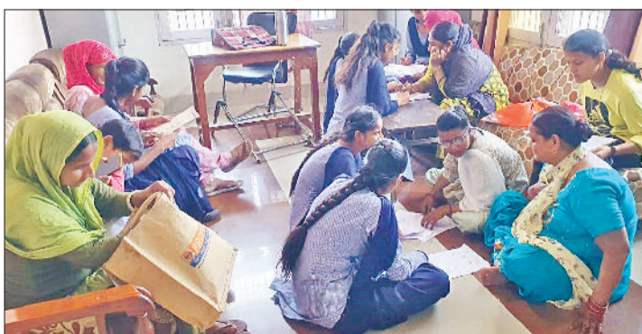
सोनीपत। पंजीकृत निरक्षरों को पढ़ाती शिक्षा विभाग की स्वयंसेवक।

जिले में उल्लास योजना के तहत सितंबर 2025 में परीक्षा देकर उत्तीर्ण होने वाले 8950 निरक्षरों को जल्द प्रमाण पत्र मुहैया करवाए जाएंगे। शिक्षा विभाग की ओर से अक्टूबर 2025 में ऐसे निरक्षरों की सूची तैयार कर मुख्यालय भेजी थी। अब मुख्यालय ने निरक्षरों के प्रमाण पत्र जारी कर दिए हैं। विभाग ने अगले सप्ताह उन्हें प्रमाण पत्र वितरण का निर्णय लिया है। उल्लास योजना के तहत सोनीपत में सितंबर 2025 की परीक्षा के लिए 10702 निरक्षरों ने पंजीकरण करवाया था। नेशनल ओपन स्कूल की ओर से जिला के सभी सात ब्लॉक में 380 केंद्र बनाए थे। इन केंद्रों पर 28 सितंबर 2025 को कुल 10702 में से 9002 निरक्षरों ने परीक्षा में भाग लिया था। 1700 निरक्षर नहीं जायें के चलते परीक्षा में शामिल नहीं हो पाए थे। परीक्षा का मूल्यांकन करने के बाद शिक्षा विभाग ने उत्तीर्ण निरक्षरों की सूची तैयार कर