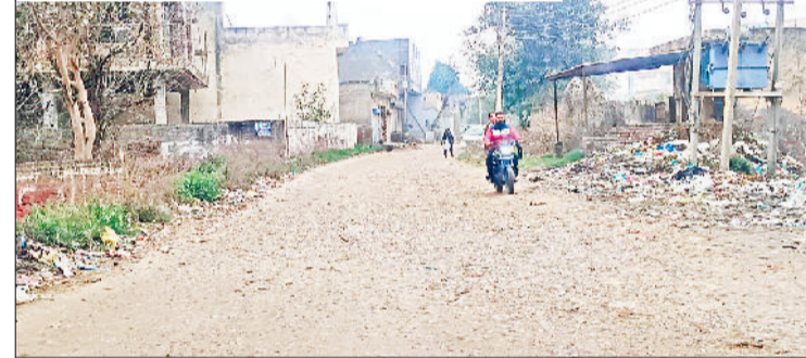
गन्नौर। चिरस्मी रोड पर बिखरे पत्थर।