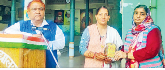
सोनीपत। कार्यक्रम में पहुंचे अतिथियों को स्मृति चिन्ह भेंट करते हुए।

स्थानीय काठ मंडी स्थित आर्य समाज द्वारा संचालित आर्य समाज में बहस्पतिवार को महर्षि दयानन्द सरस्वती की 202वीं जयंती के उपलक्ष्य में भाषण एवं प्रश्नोत्तरी का आयोजन किया गया। प्रतियोगिता में महाशय रूपचंद आर्य सदन, स्वामी दयानन्द सरस्वती सदन और सूरत सिंह आर्य सदन के बच्चों ने बड़ चढ़कर हिस्सा लिया। प्राचार्य