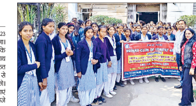
सोनीपत। रावल अस्पताल के बाहर छात्राएं साथ में क्लब के पदाधिकारी एवं अन्य।