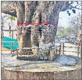
हरिभूमि न्यूज ▶▶ सोनीपत