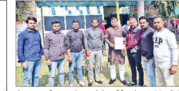
गोहाना। भाजपा जिलाध्यक्ष को जापन सौंपते हुए सीपीएलओ।