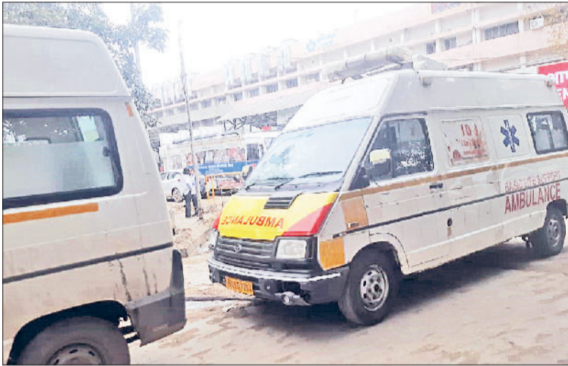
सोनीपत। नागरिक अस्पताल में रस्सी बांधकर खींची जा रही एंबुलेंस।

स्वास्थ्य विभाग की लचर व्यवस्था के चलते लोगों की जान बचाने में सहायक जीवनवाहनी (एंबुलेंस) खुद बीमारी की स्थिति हैं, जबकि अक्टूबर 2025 में विभाग को मिली चार एंबुलेंस को केवल शोपीस के तौर पर रखा गया है। यह एंबुलेंस दिल्ली रोड स्थित नागरिक अस्पताल परिसर में सिविल सर्जन कार्यालय के बाहर खड़ी धूल फांक रही हैं। आलम यह है कि अधिकारियों का इस ओर कोई ध्यान नहीं है। उधर पुरानी एंबुलेंस को रस्सी के सहारे खींचकर चलाया जा रहा है। जिला स्वास्थ्य विभाग के पास कुल 27 एंबुलेंस की व्यवस्था है। हालांकि इनमें करीब 13 एंबुलेंस ऐसी हैं, जो विभाग के नॉर्स (मानक) पूरे कर चुकी हैं। यह एंबुलेंस 3 लाख किलोमीटर चलने के साथ अपना 5 वर्ष का कार्यकाल पूरा कर चुकी हैं। इसके बावजूद विभाग पुरानी एंबुलेंस के सहारे जिले की स्वास्थ्य व्यवस्था को दुरुस्त बनाने में जुटा है। इतना ही नहीं, विभाग की ओर से गर्भवती व अन्य गंभीर हालत के मरीजों को इन्हीं एंबुलेंस के सहारे रेफर कर उनकी जान को जोखिम में डाला जा रहा है। अगर इस अवस्था में एंबुलेंस बीच रास्ते में खराब हो जाती है तो दूसरी एंबुलेंस मंगवाकर मरीजों को इलाज के लिए भेजा जाता है। ऐसे में नागरिक अस्पताल सहित स्वास्थ्य केंद्रों पर इलाज की आस लेकर पहुंचने वाले मरीजों को भटकना पड़ रहा है।