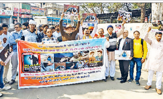
सोनीपत। विरोध प्रदर्शन करते सामाजिक संगठनों के पदाधिकारी एवं सदस्यगण।